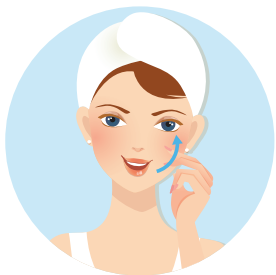
3. 按摩法令紋處 並向上拉提