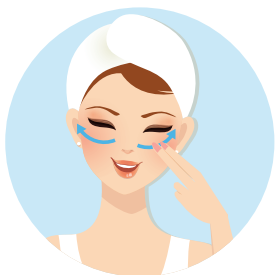
1. 眼部拉提至太陽穴