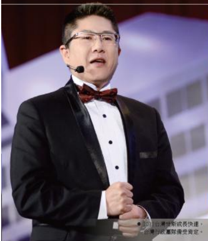
● 2011台灣婕斯成長快速，台灣行政團隊備受肯定。