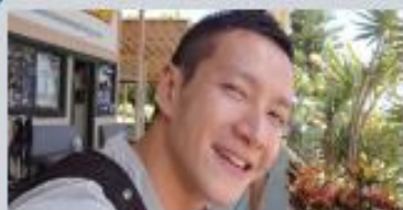
◆ 拉烏 ◆

感謝我的推薦人，讓我遇見婚斯，因而找到我的熱情，助人是我的人生宗旨，曾經在某處看到成功的人大特質，除了熱情之外還有，勤奮、專注、積極、想法、進步、服務、執著，我將全力以赴達成，並追隨婚斯的那步，把美麗與希望帶給全世界，感恩。